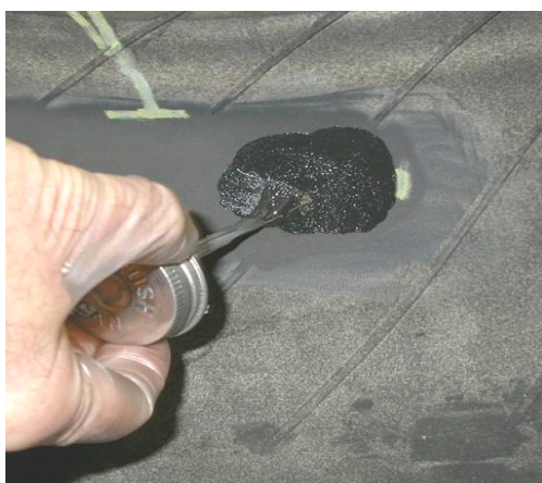
把胶水刷涂在已处理好的区域，同时在补丁标签灰胶表面也刷涂胶水。