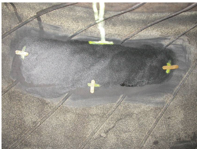
涂上胶水后晾 5~10 分钟（视温度而定）

把补丁标签背面的蓝色包装撕掉，不要用手触摸背面灰色的粘合胶以及已经处理好的轮胎表面。补丁标签贴到轮胎上至少 24 小时后才能装车，以保证完全硫化。