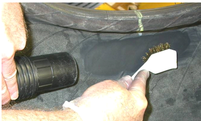
用吸尘器和铜刷清除抛光表面残留的抛光粉粒