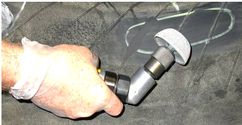
用打磨机把标定区域抛光平滑